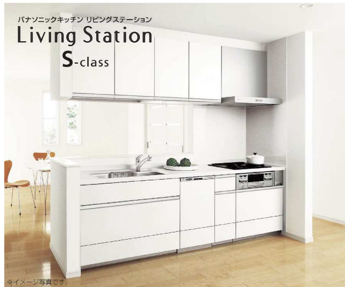
パナソニックキッチン リビングステーション Living Station S-class